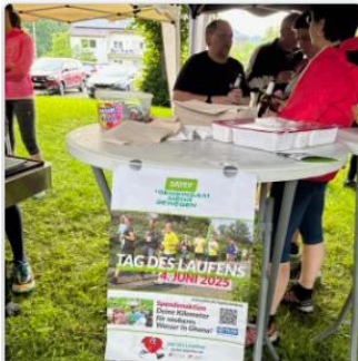
Tag des Laufens 2025 - der Lauftreff Running & More ist dabei

Am 04.06. fand wieder der bundesweite "Tag des Laufens" statt - eine Initiative vom DLV & German Road Races; klar dass der Lauftreff Running & More... more